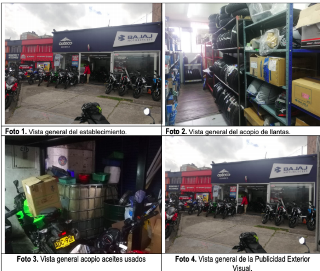
Foto 1. Vista general del establecimiento.

Por lo anterior se procede a realizar visita de seguimiento (Tercera visita) el día 22 de agosto de 2019 al establecimiento DISTRIBUIDORA AMERINDA de la razón social DISTRIBUIDORA AMERINDA SAS , con el fin de verificar el cumplimiento del requerimiento SDA 2019EE07010 del 11 de enero de 2019 , evidenciando que el establecimiento no ha cumplido con lo solicitado en el requerimiento mencionado en el presente párrafo.